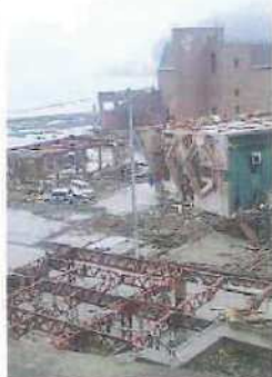
宮城県女川中心地

3月11日に起こった東日本大震災。多くの被害を受けましたが、その多くは弱い立場にある高齢者でした。私たちの仲間である「なるせの里デイサービス」（宮城県松島町）では、30名さまの小学校に避難中、津波にさらわれ利用者12名と職員3名が犠牲になりました。又、避難所では、未だに仮設住宅にも入れない、仮設に当たっても、生活費がない、話し相手がない、買い物や病院に行く交通手段がないことで、行きたがらない人達が沢山います。本当に心優しい支援が求められます。青葉苑からは、20万円相当の支援物資を送り、職員1名を1週間現地の支援に送りました。