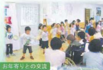
お年寄りとの交流